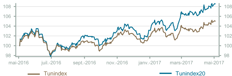
Évolution du Tunindex & Tunindex 20 (en glissement annuel)