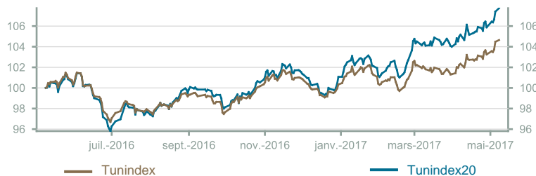
Évolution du Tunindex & Tunindex 20 (en glissement annuel)