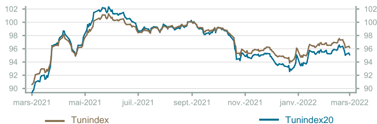
Évolution du Tunindex & Tunindex 20 (en glissement annuel)