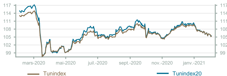
Évolution du Tunindex & Tunindex 20 (en glissement annuel)