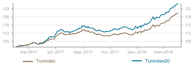
Évolution du Tunindex & Tunindex 20 (en glissement annuel)