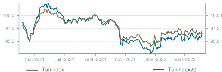
Évolution du Tunindex & Tunindex 20 (en glissement annuel)