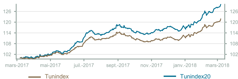
Évolution du Tunindex & Tunindex 20 (en glissement annuel)