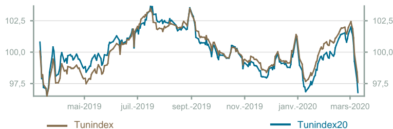
Évolution du Tunindex & Tunindex 20 (en glissement annuel)