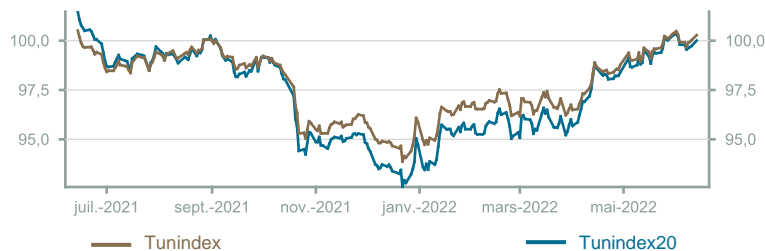
Évolution du Tunindex & Tunindex 20 (en glissement annuel)