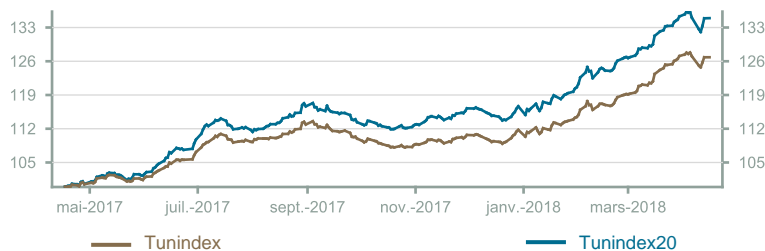
Évolution du Tunindex & Tunindex 20 (en glissement annuel)