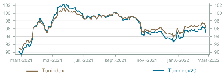
Évolution du Tunindex & Tunindex 20 (en glissement annuel)