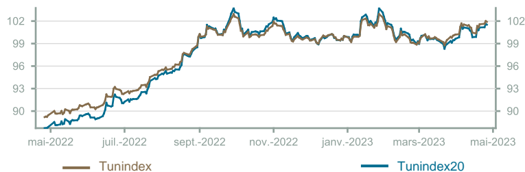
Évolution du Tunindex & Tunindex 20 (en glissement annuel)