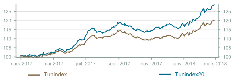
Évolution du Tunindex & Tunindex 20 (en glissement annuel)