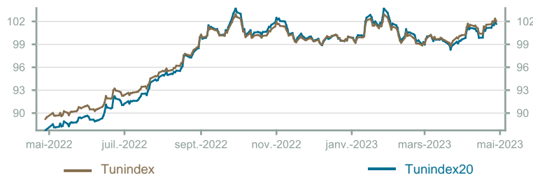
Évolution du Tunindex & Tunindex 20 (en glissement annuel)