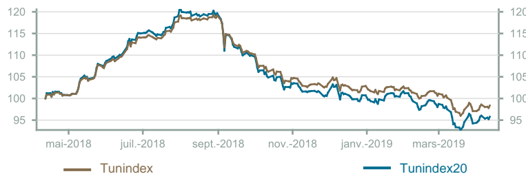
Évolution du Tunindex & Tunindex 20 (en glissement annuel)