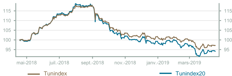
Évolution du Tunindex & Tunindex 20 (en glissement annuel)