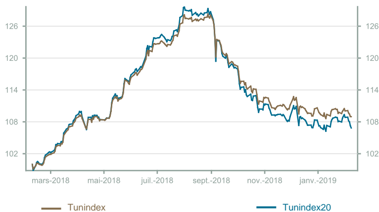
Évolution du Tunindex & Tunindex 20 (en glissement annuel)