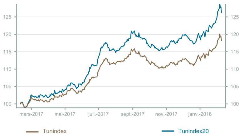
Évolution du Tunindex & Tunindex 20 (en glissement annuel)