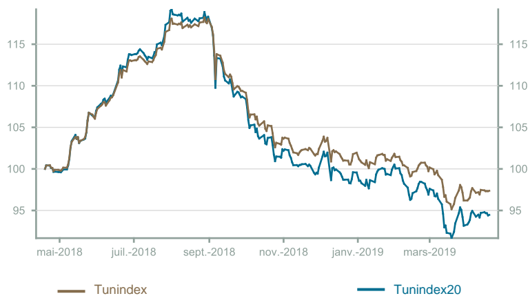
Évolution du Tunindex & Tunindex 20 (en glissement annuel)