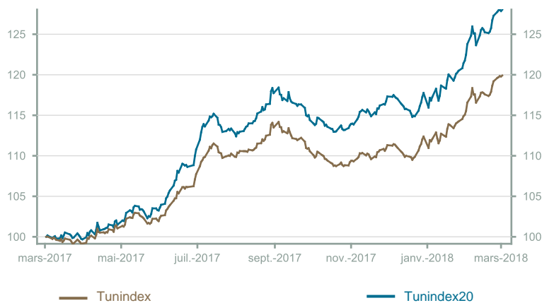
Évolution du Tunindex & Tunindex 20 (en glissement annuel)